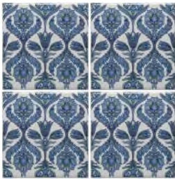
Dit is juist, want alle vier de tegels zijn naar boven gericht

De ontwerpen op deze siertegels worden gekenmerkt door een subtiele asymmetrie. Om een patroon met mooie herhalingen te maken, legt u de tegels neer voordat u ze bevestigt tegen de muur. Zorg ervoor dat de patronen van de vier hoeken op elkaar aansluiten.