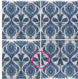
Dit is onjuist, want de patronen aan de zijkanten sluiten niet op elkaar aan, aangezien de tegel rechtsonder ondersteboven is aangebracht