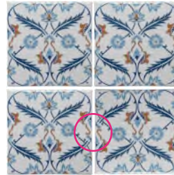
Dit is onjuist, want de patronen aan de zijkanten sluiten niet op elkaar aan, aangezien de tegel rechtsonder ondersteboven is aangebracht