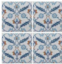
Dit is juist, want alle vier de tegels zijn naar boven gericht